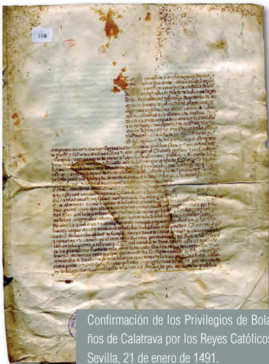
Confirmación de los Privilegios de Bolaños de Calatrava por los Reyes Católicos. Sevilla, 21 de enero de 1491.

En todo caso el usuario, contará con la orientación de un archivero, que le aconsejará y dirigirá en sus búsquedas e intentará guiarle en la medida de sus posibilidades ■