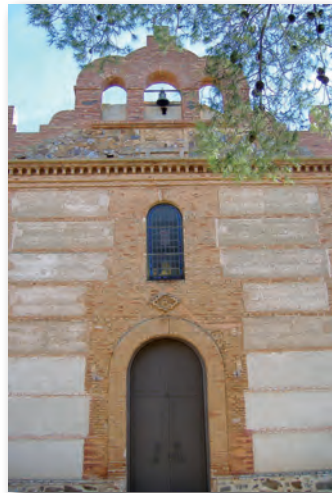
Santuario de la Virgen del Monte.

Con el alma edificada, cruzaremos el arroyo Cuetos, para adentrarnos en terrenos de labor, dominados por el olivar, aquí donde antiguamente reinaba la encina, y