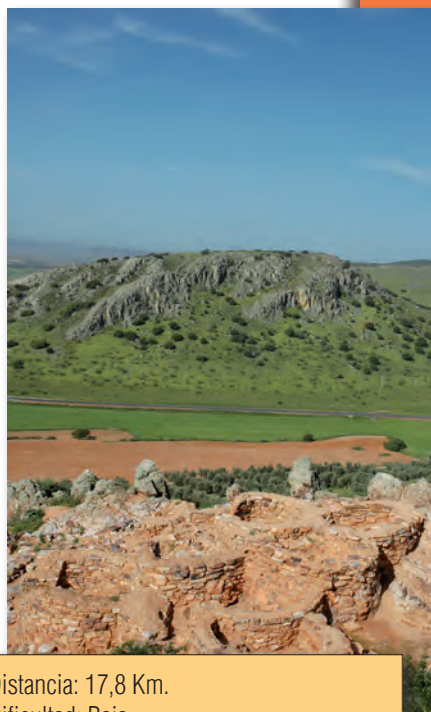
La Encantada. Yacimiento de la Edad del Bronce.

Desde este punto, atravesando la valla que rodea la casa del Pardillo, tomaremos la senda de los Castillones, para llegar a lo alto de una loma donde se asentaron los poblados de altura de la Edad del Bronce. Desde aquí las panorámicas sobre la gran llanura manchega son sorprendentes. Ascendiendo a la cima de los Castillones, los restos desparramados